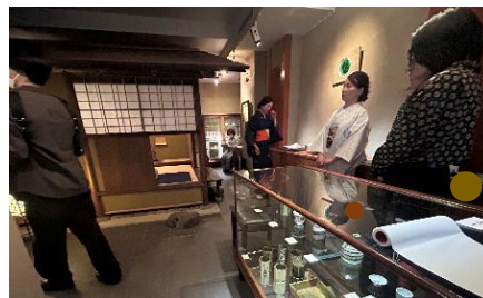
次々と人が訪れる魯卿あんの店内